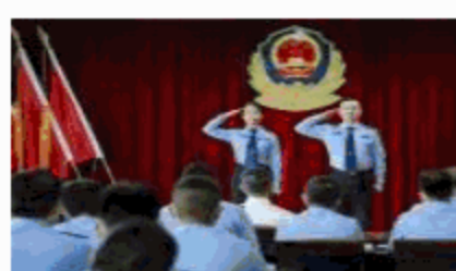
洛阳铁路公安处举办迎国庆“学 讲话 悟思想 铸忠诚 勇担当”为 主题的演讲比赛