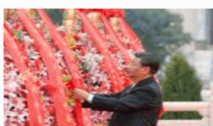
烈士纪念日向人民英雄敬献花篮 仪式在京隆重举行