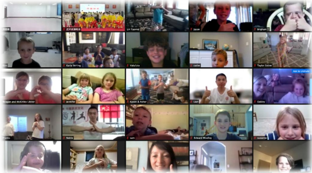
在线学员对功夫活动和汉语教学点赞

月“汉语桥—中文+武术”印度尼西亚中学生线上团组交流项目开营；7月“汉语桥—中文+武术”哥斯达黎加线上功夫营正式开营；8月“汉语桥—感知中国”伊拉克库尔德地区线上功夫营等。