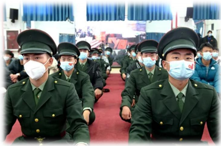
国防班学生正在班级里上军事理论课

四是狠抓日常军事训练，突出军事育人效果。今年，加大了对青年教师、教官、校企教师的培养和培训力度；培育教师的奉献担当精神和荣辱与共意识，积极引导教师把主要精力投入到教育教学、军事训练中，形成赶、比、超的良好教风。培育了百余人的“四会”（会讲、会练、会教、会做思想工作）军训教官队伍，为今后开展军训和提升横向服务和非学历培训水平奠定了基础。