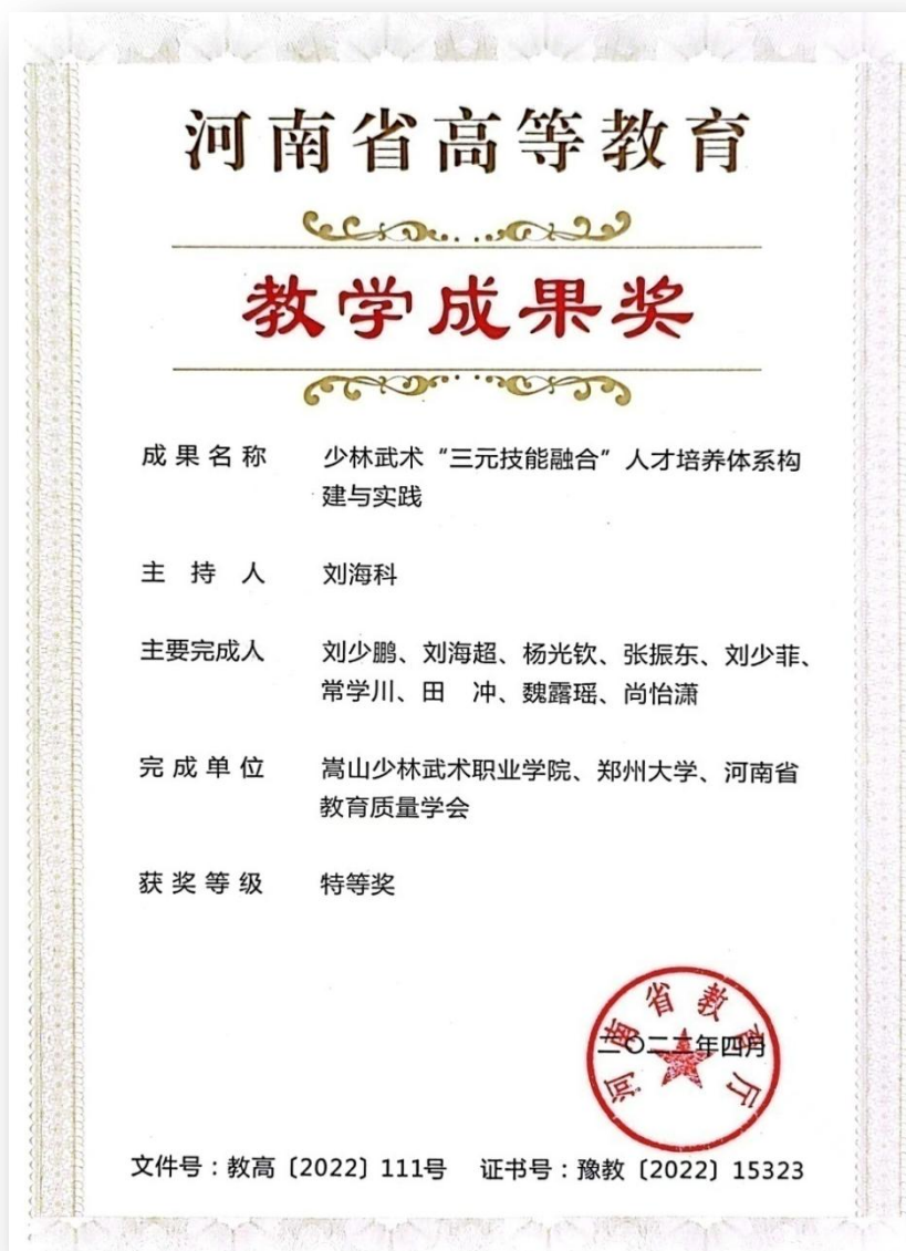
刘海科教授主持的教学项目荣获省级特等奖