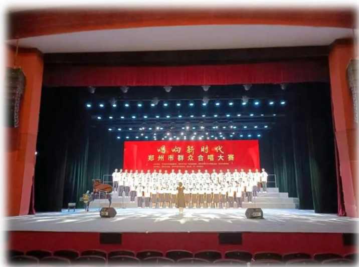
“唱响新时代”郑州市群众合唱大赛表演剪影

本次大赛分为机关单位组、高校组、社会团体组、中小学组、企业单位组五个组别进行比赛，有近 50 支代表队的 3000 余名合唱队员参加。央视频、郑州文旅云、郑州文化馆等多家平台以现场直播的形式同步给海内外观众，人民网、河南日报、腾讯网、搜狐网等多家媒体进行了宣传报道。