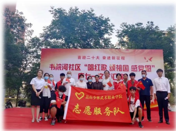
志愿者服务全体合影

星之希望登封专项志愿服务团队本次“唱红歌，颂祖国，感党恩，庆七一”志愿活动圆满结束。