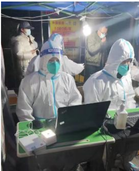
校医院随时待命为师生做核酸检测

舍，把精细化管理落实到每位学生，用忠诚和信仰诠释着辅导员的责任和使命，用担当和奉献守护着学生们的健康和安