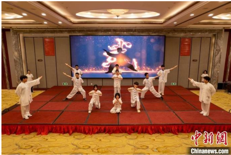
图为汇演节目《中华武术魂》。