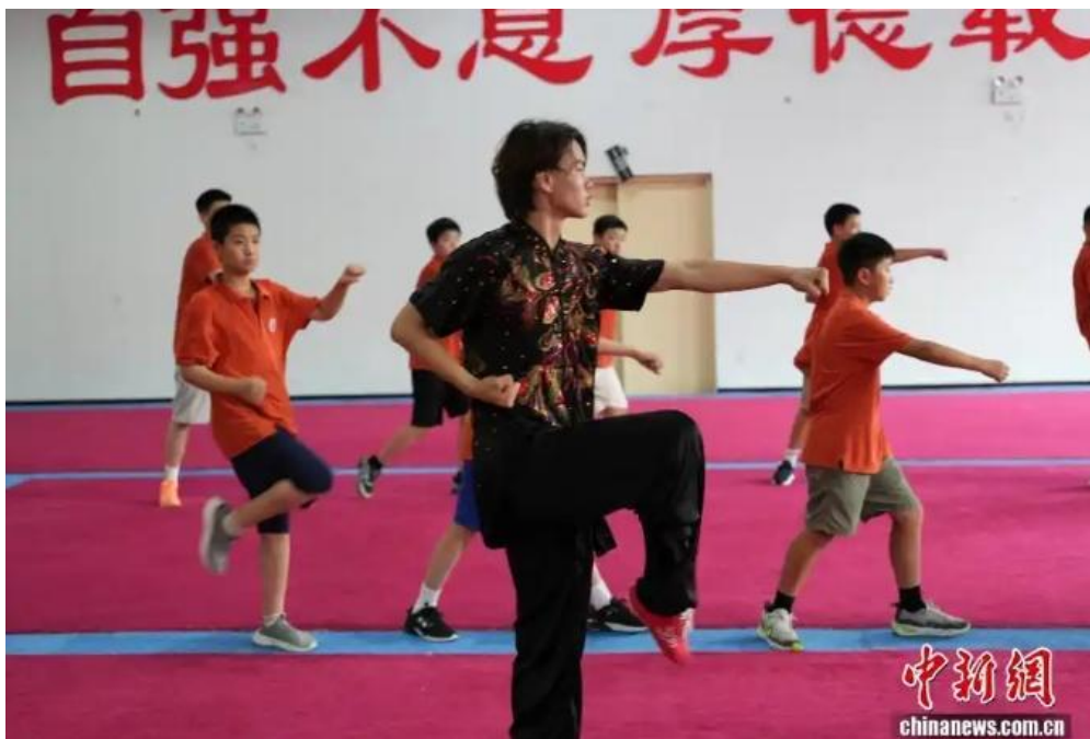
图为海外华裔青少年学习少林功夫。

7月24日，参加第八届全球华语朗诵大赛河南集结营研学的海外华裔青少年走进河南登封市，学习、体验少林功夫，感受中华武术文化魅力。