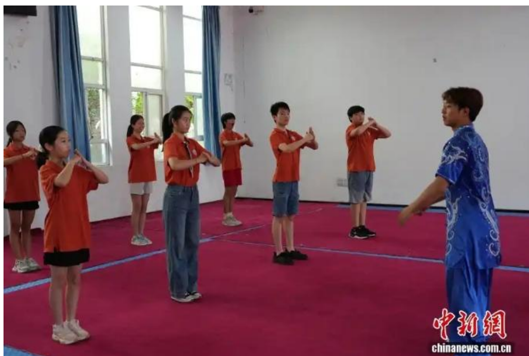
图为海外华裔青少年学习少林功夫。

7月24日，参加第八届全球华语朗诵大赛河南集结营研学的海外华裔青少年走进河南登封市，学习、体验少林功夫，感受中华武术文化魅力。