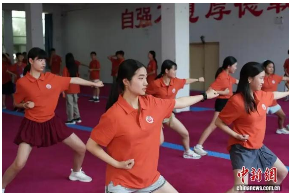
图为海外华裔青少年学习少林功夫。

7月24日，参加第八届全球华语朗诵大赛河南集结营研学的海外华裔青少年走进河南登封市，学习、体验少林功夫，感受中华武术文化魅力。