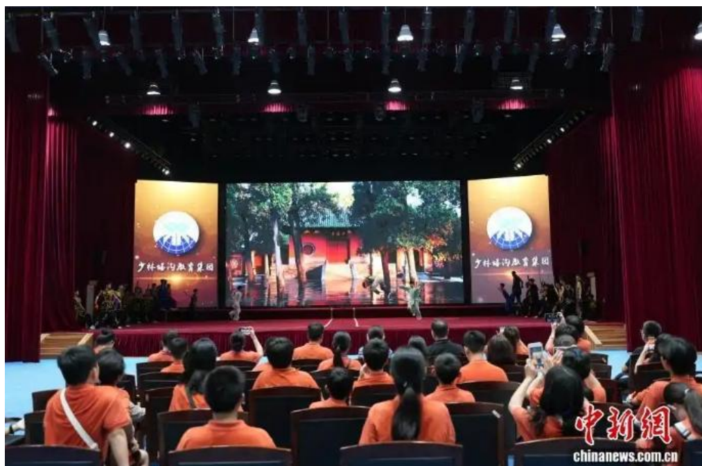
图为海外华裔青少年欣赏少林武术教学成果展。

7月24日，参加第八届全球华语朗诵大赛河南集结营研学的海外华裔青少年走进河南登封市，学习、体验少林功夫，感受中华武术文化魅力。