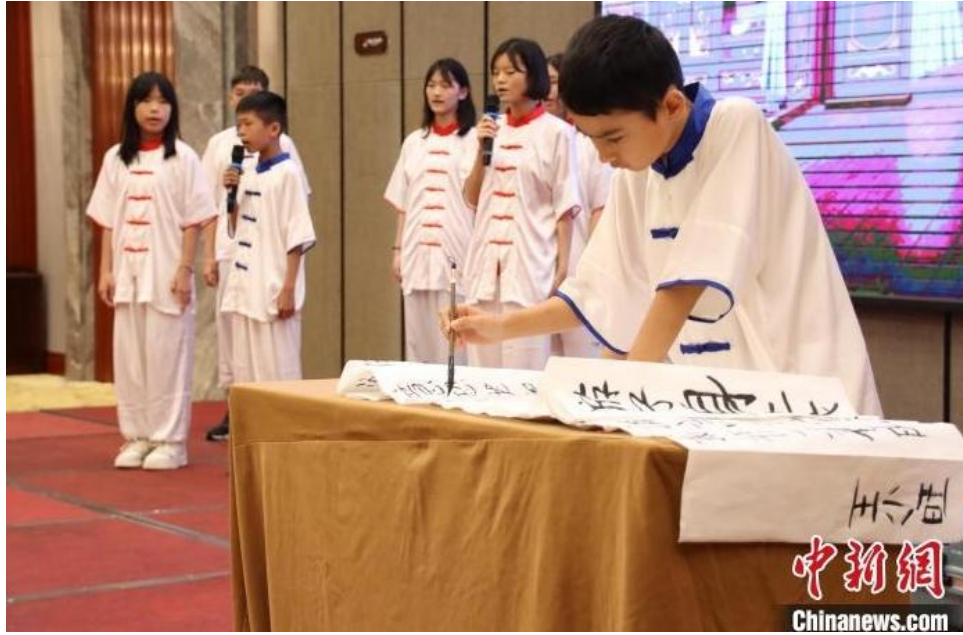
图为汇演节目《游子吟》。

“河南中，中国真中！”来自马来西亚的温紫芯用刚学会的河南话说道，此次夏令营她不仅学习到了少林武术、中华古诗和传统茶艺等，还在参访过程中第一次了解到“客家人根在河洛”，身为客家人的她第一次在河南找到了“根”，她决定将此行收获，分享给远在马来西亚的家人及朋友。