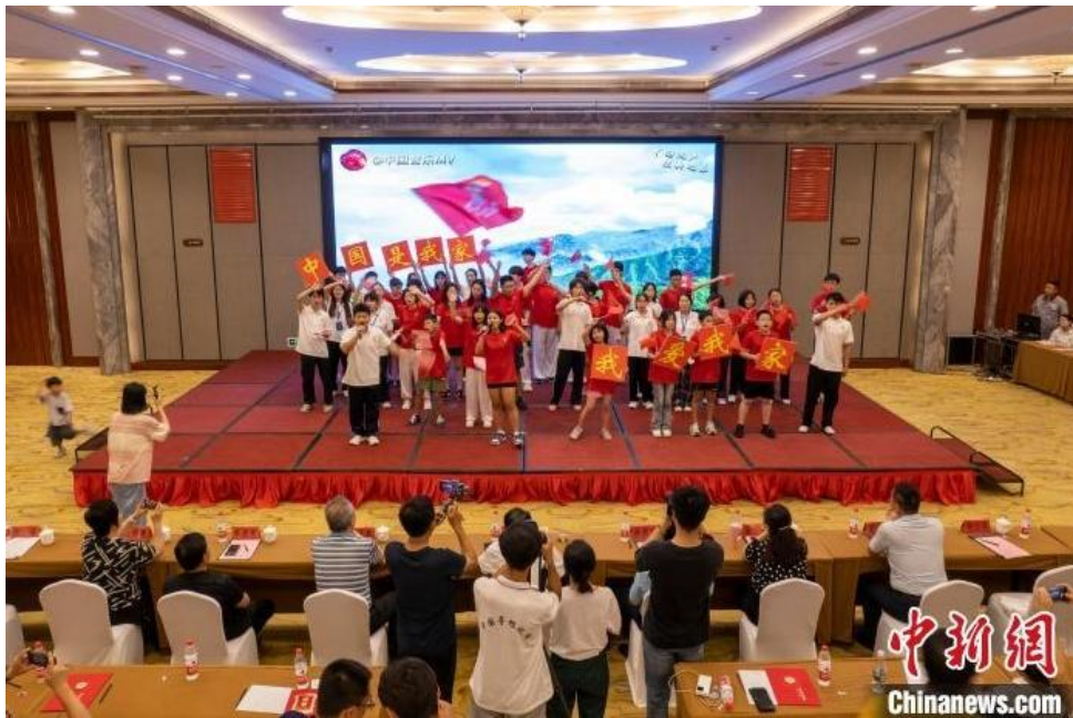
图为汇演节目《大中国》大合唱。