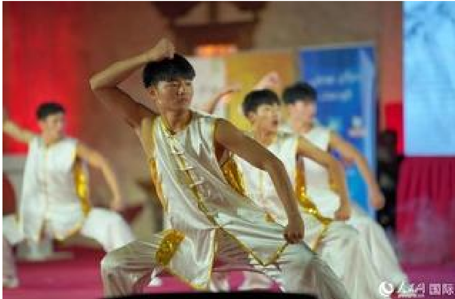
演出一景。

伊拉克总统夫人莎南·易卜拉欣·艾哈迈德在观看演出后表示，中国武术文化博大精深。“古老的武术和民乐相结合，讲述了人类面对逆境不懈奋斗的故事。”她期待未来能够有更多的交流机会，通过文化和艺术拉近两国人民之间的距离。