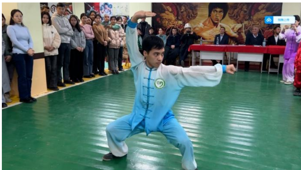
优秀营员教学成果展

为期两个月的文化交流营期间，营员们通过“云端”学习少林功法、少林五行拳、少林功夫扇等中华武术套路，感受中华武术的魅力。同时学习中国功夫养生文化、中国茶文化、中医药文化、中国现代网络文化、中国电子商务文化等，认识中华文化孕育的独特社会历史风情，了解当代中国社会的多个领域。文化交流营活动，不仅让营员们收获了一段精彩的云上中华文化交流之旅，而且在当地掀起了一股学习武术的热潮。