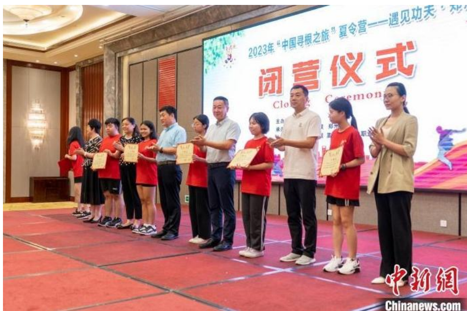
图为部分营员领取结业证书。

此次2023“中国寻根之旅”夏令营——遇见功夫·郑州营由中国侨联主办，河南省侨联、郑州市侨联承办，登封市侨联、嵩山少林武术职业学院协办。活动期间，营员们参访了少林寺、嵩阳书院、河南博物院和新郑黄帝故里等地，学习了诗歌、书法以及少林武术等，在河南郑州与中国传统文化相遇，探寻“根”之所在。