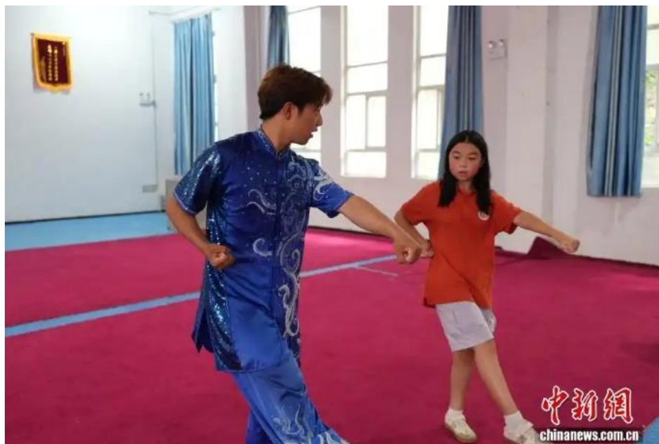
图为海外华裔青少年在登封少林武术职业学院学习少林功夫。

7月24日，参加第八届全球华语朗诵大赛河南集结营研学的海外华裔青少年走进河南登封市，学习、体验少林功夫，感受中华武术文化魅力。