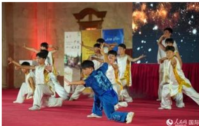
演出场景。

人民网迪拜10月4日电（记者管克江、任皓宇）近日，由嵩山少林武术职业学院派出的“武林汉韵”表演团来到伊拉克北部库尔德地区的苏莱曼尼亚罗马剧院，为当地民众献上了一场刚与柔并济、力与美结合的文化演出。整场演出由《少林禅拳》《天地人和》《少林十八般兵器》《少林绝技》《古筝独奏曲》等12个节目组成，“少林功夫+传统民乐”的方式打动了在场1万多名观众。