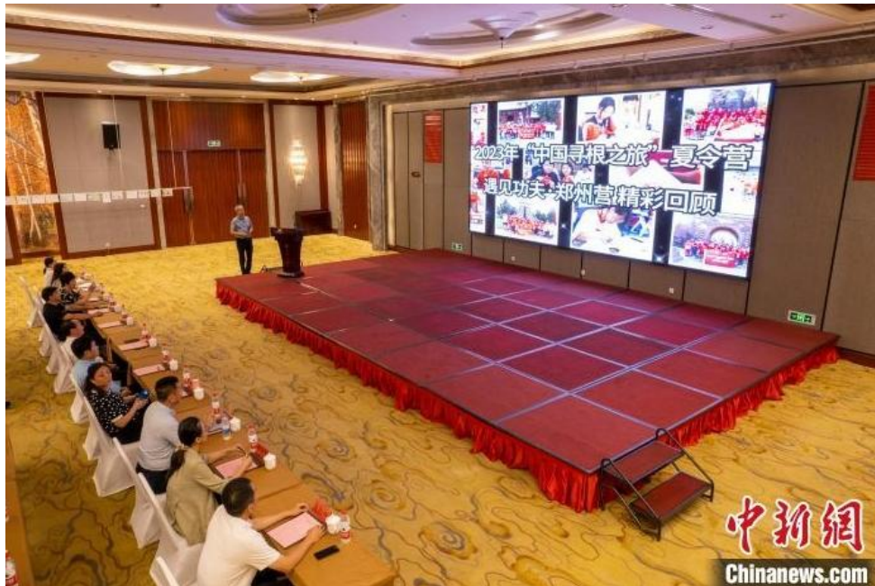
图为精彩回顾。

闭营仪式上，河南省侨联二级巡视员刘合生在致辞中表示，此次夏令营活动让华裔青少年学习了中华武术，了解了民族历史，感知和体验了中华文化的源远流长和博大精深，增进了彼此的情谊。他寄语华裔青少年们：“希望你们在返回住在国后，将在河南郑州所见所闻，讲给亲人、朋友和同学听，让世界更好地亲近河南、了解中国。”