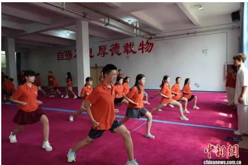
图为海外华裔青少年学习少林功夫。

7月24日，参加第八届全球华语朗诵大赛河南集结营研学的海外华裔青少年走进河南登封市，学习、体验少林功夫，感受中华武术文化魅力。